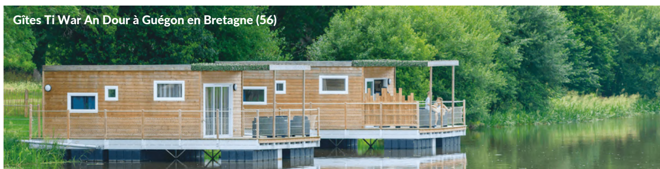
Gîtes Ti War An Dour à Guégon en Bretagne (56)

Depuis 2022, les professionnels sont également enjoins à mettre en œuvre au moins deux initiatives de protection de la biodiversité au sein de leur établissement ou sur leur territoire , ce qui représente un total de plus de 2 000 initiatives. Parmi les plus marquantes : gestion différenciée des espaces verts avec notamment l'arrêt du taillage des haies pendant la période de nidification des oiseaux, mise en place de potagers en permaculture accompagnés d'activité de sensibilisation à l'environnement pour la clientèle, constitution d'espaces de jachère fleurie avec des plantes locales, entretien de mares et d'étangs, favorisation de la libre circulation de la faune locale grâce à la découpe des bas de grillages.