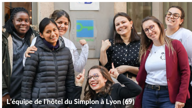
L'équipe de l'hôtel du Simplon à Lyon (69)