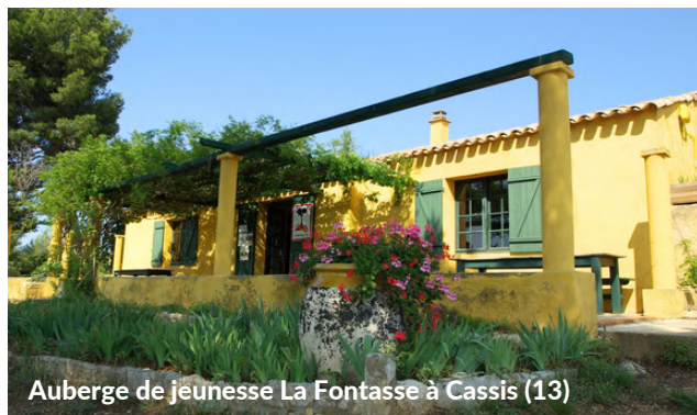
Auberge de jeunesse La Fontasse à Cassis (13)